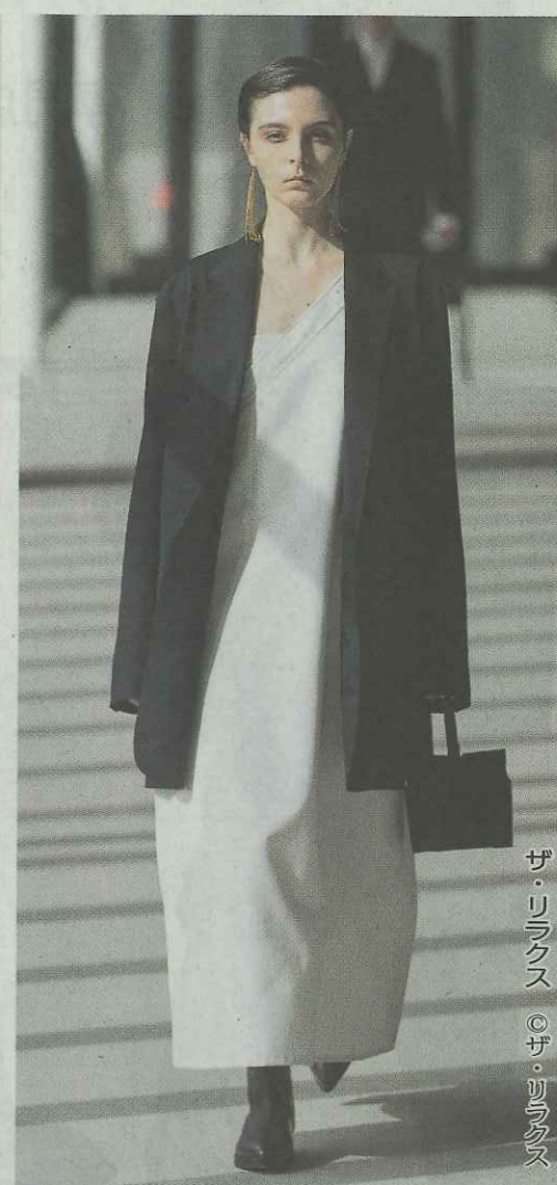
ザ・リラクス ©ザ・リラクス