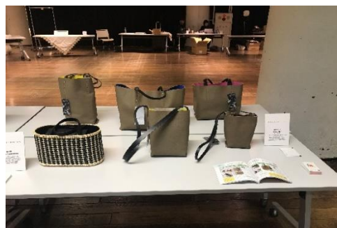
KOBE LEATHER×Maison Def(豊岡のかばん)