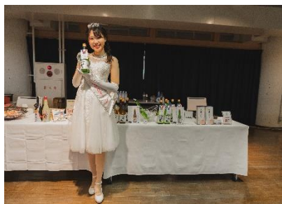
神戸ウェディング会議