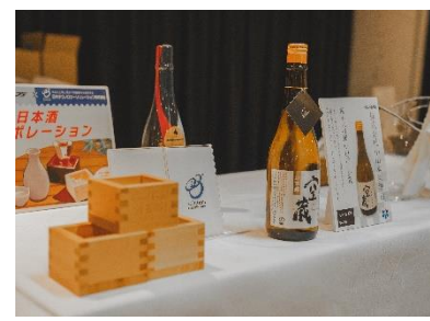
日本テクノロジーソリューションズ