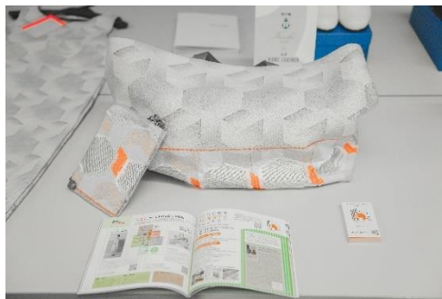
KOBE LEATHER×THYME BUCKS(豊岡のかばん)