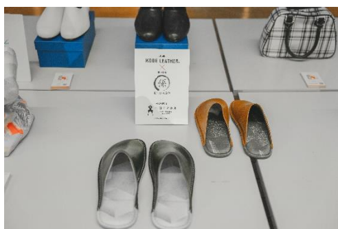
KOBE LEATHER×ENMAGO(播州織)×永田良介商店