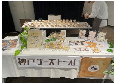
神戸チーズトースト