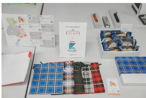
リトル神戸×KAGEYAMA(播州織)