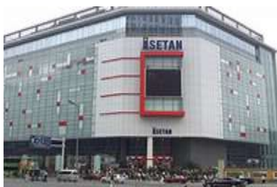
天津伊勢丹 1 号店