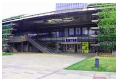
天津伊勢丹 2 号店