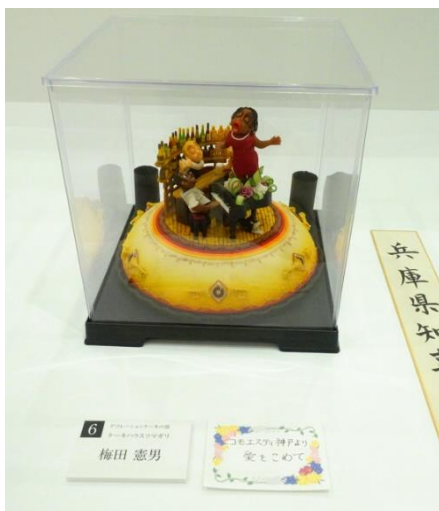
(デコレーションケーキの部)