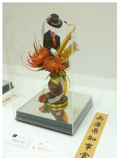
(ピエス・アーティスティックの部)